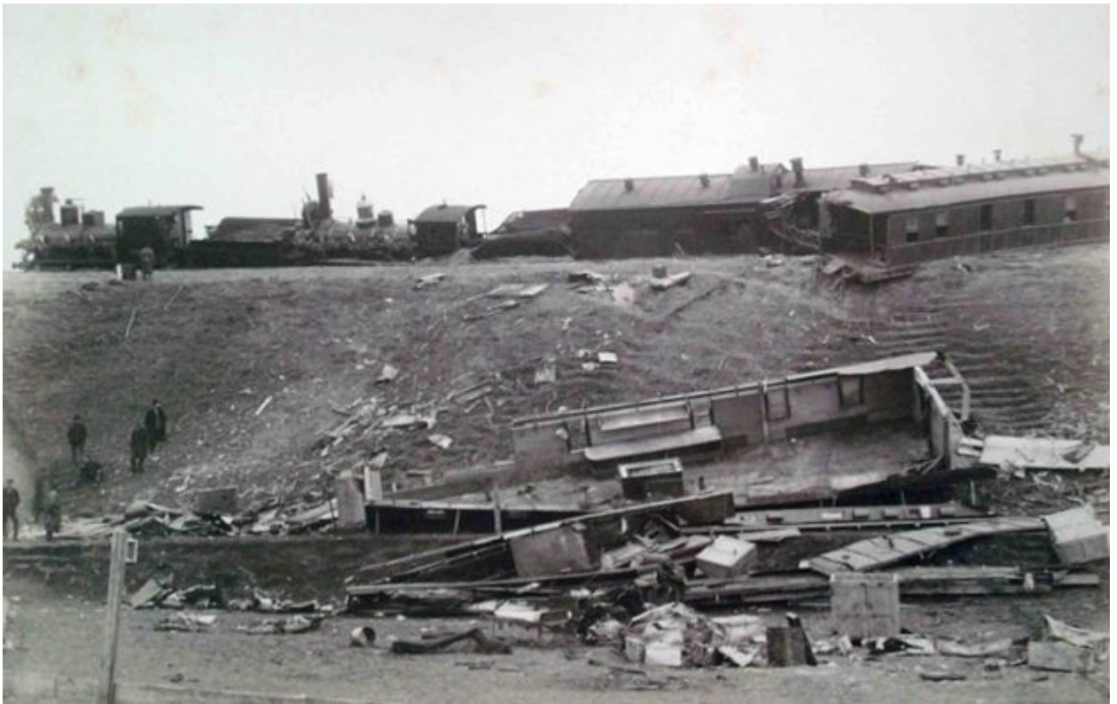
фотография А.М. Иваницкого